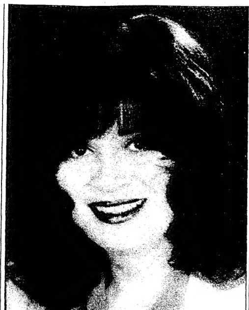
سيدة الفنانة الهام شاهين مع زوجها في حفل زفافهما.

تمت زراعة كبد في حيوانات التجارب، وهو ما يعد خطوة مهمة في علاج المرضى الذين يعانون من أمراض الكبد المزمنة. تم إجراء التجربة في جامعة ييل في الولايات المتحدة، حيث تم نقل كبد من فئران سليمة إلى فئران مصابة بمرض الكبد المزمن. نجحت التجربة في جعل الجسم يقبل الأعضاء المزروعة دون الحاجة إلى أدوية مثبطة للمناعة، وهو ما يعد إنجازاً كبيراً في مجال الطب الجيني. تم إجراء التجربة في جامعة ييل في الولايات المتحدة، حيث تم نقل كبد من فئران سليمة إلى فئران مصابة بمرض الكبد المزمن. نجحت التجربة في جعل الجسم يقبل الأعضاء المزروعة دون الحاجة إلى أدوية مثبطة للمناعة، وهو ما يعد إنجازاً كبيراً في مجال الطب الجيني.